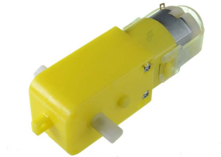
Imagen demostrativa de motores

En esta versión de la competencia, solo se permitirá el uso de motores con engranaje plástico para la tracción, así mismo queda prohibido el uso de navajas y chasis metálico. Se permite el uso de kits preensamblados.